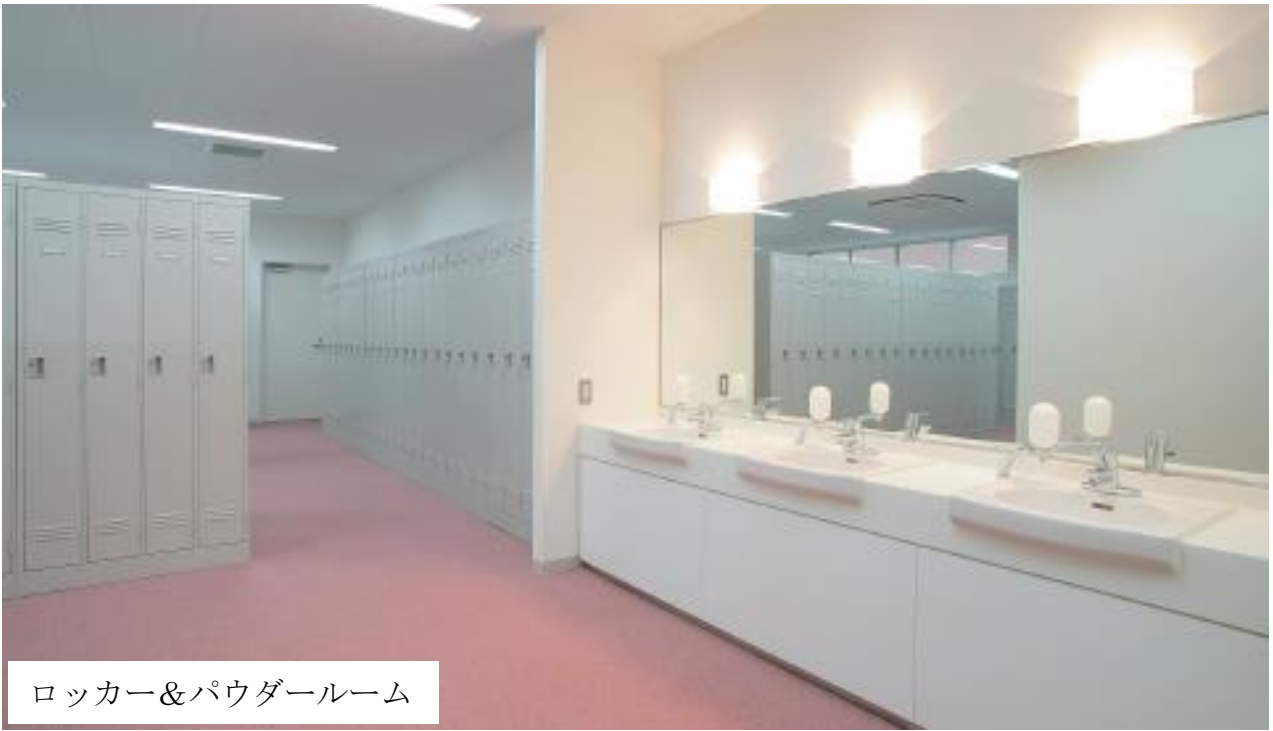
ロッカー&パウダールーム