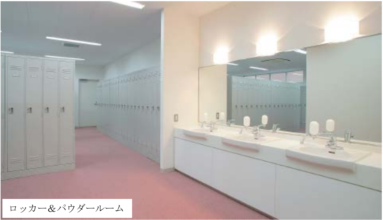
ロッカー&パウダールーム