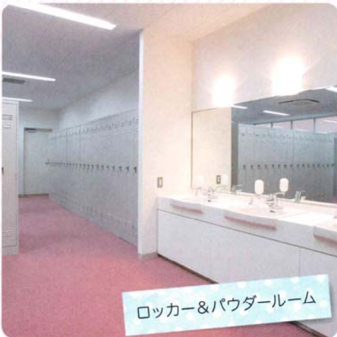
ロッカー&パウダールーム